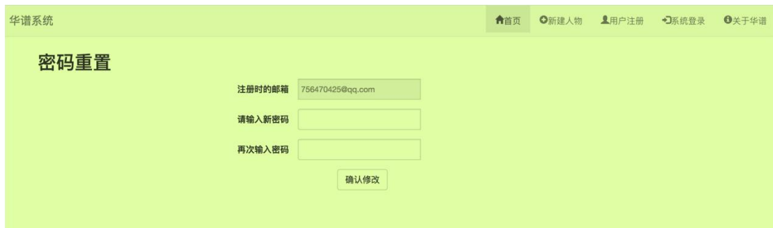
图 3. 密码重置页