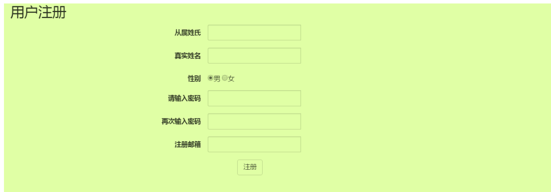
图 1. 用户注册页