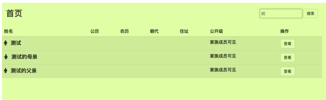
图 6. 搜索页

在 搜索框中输入搜索人的姓名，点击搜索按钮，可以快速筛选出符合条件的人物信息，如图 6 所示。